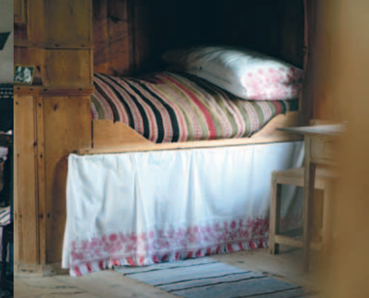
Bergsjö hembygds gård /Delsbo forngård

I MÅNGA HÄLSINGEGÅRDAR FINNS MAGNIFIKA INTERIÖRER MED VÄGGMÅLNINGAR ELLER GAMLA TAPETER. KONSTNÄRERNA ISCENSÄTTER OFTA BIBLISKA BERÄTTELSE I HÄLSINGEMILJÖER. DE TRE VISE MÄNNEN FÅR RIDA PÅ SVENSKA HÄSTAR OCH OMGES AV PINJER OCH FANTASIBLOMMOR. SENTENSER UR BIBELN MANAR TILL EFTERTANKE. DET FINNS OCKSÅ VÄGGMÅLNINGAR MED MOTIV UR MODEKATALOGER.