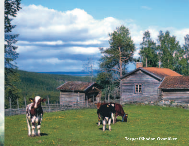
Torpet fäbodår, Ovanåker

I dag finns en handfull aktiva fäbodbrukare i länet. De försöker anpassa gamla traditioner till moderna brukningsmetoder. Genom deras arbete förs kunskaperna vidare samtidigt som gamla fäbodmarker hålls öppna och ger en bild av hur livet tedde sig i det traditionella jordbrukssamhället. För mer information om fäbodvallar att besöka, se www.xfabodar.se .