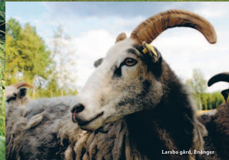
Larsbo gård, Enånger